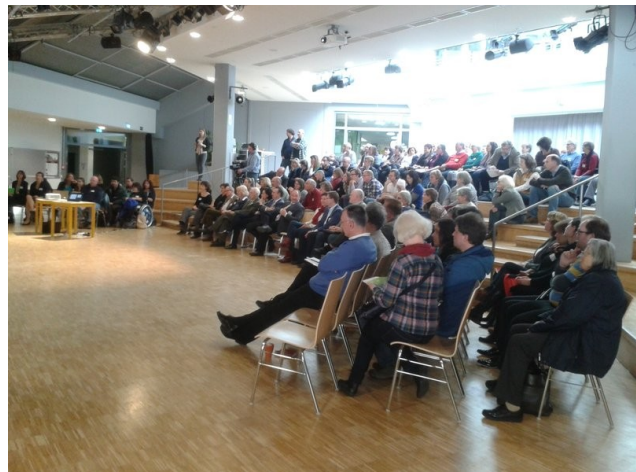
Alle Erwartungen übertroffen: Akteure und Teilnehmer in der Aula des Gilchinger Gymnasiums.

Ziel der Auftaktveranstaltung war die Umsetzung der UN-Behindertenrechtskonvention im Landkreis Starnberg mit Unterstützung des Aktionsplans für Menschen mit Behinderungen.