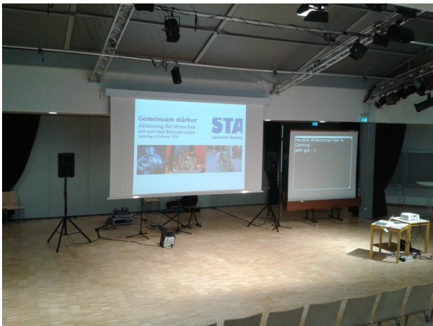
Beamer und Leinwände: Auch für den Schriftdolmetschereinsatz, im Bild rechts.

Am 06.02.2016 fand im Gilchinger Christoph-Probst-Gymnasium unter dem Motto „Gemeinsam stärker“ der Aktionstag für Menschen mit und ohne Behinderungen statt.