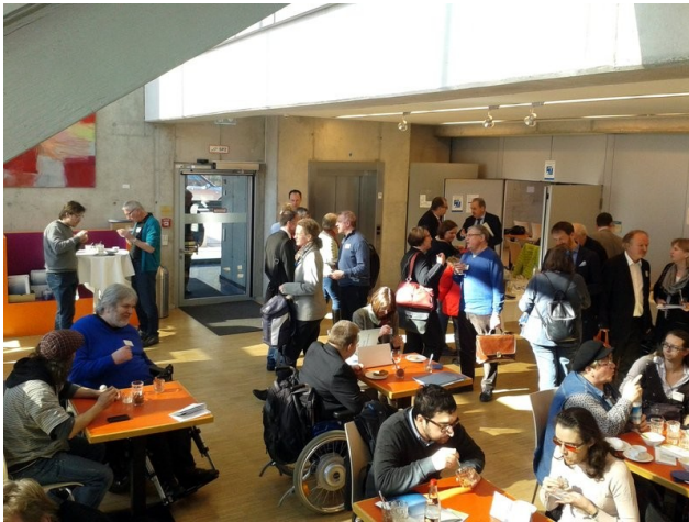
Verschnaufruhe: Teilnehmer der Fachtagung im Erdgeschoss.. (Foto: Martin Langscheid).