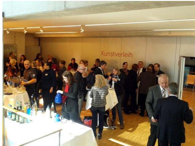
...im ersten und zweiten Stock des Kulturhauses.

Sieben Workshops mit den Themen Arbeit, Barrierefreiheit, Bildung, Gesundheit sowie Partizipation, unabhängige Lebensführung und Wohnen standen bei der Fachtagung auf dem Programm.